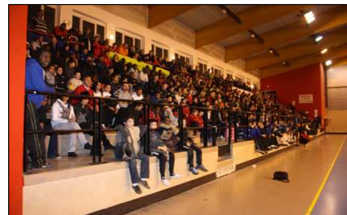
LA TRIBUNE DE BUSSIÈRE