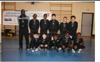
NOISY LE SEC