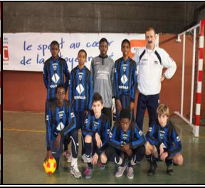
LE BLANC MESNIL