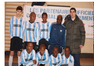
AS CHOISY LE ROI