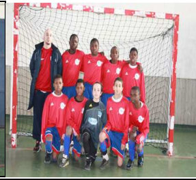
CTRE FORMAT° PARIS