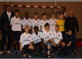
PARIS SAINT GERMAIN