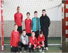
ST GERMAIN LAVAL