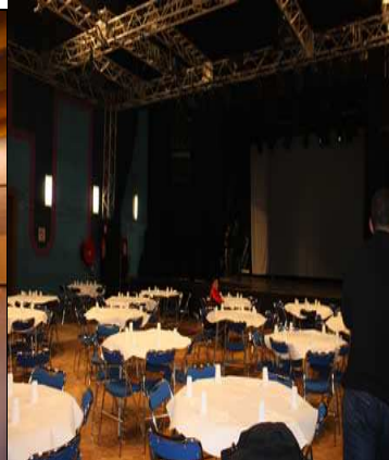
SOIREE PAELLA SALLE DES FETES AVEC LE GROUPE MONDOTEK