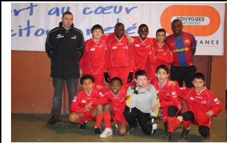
SEVRAN FC 2