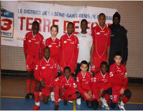
SEVRAN FC 1